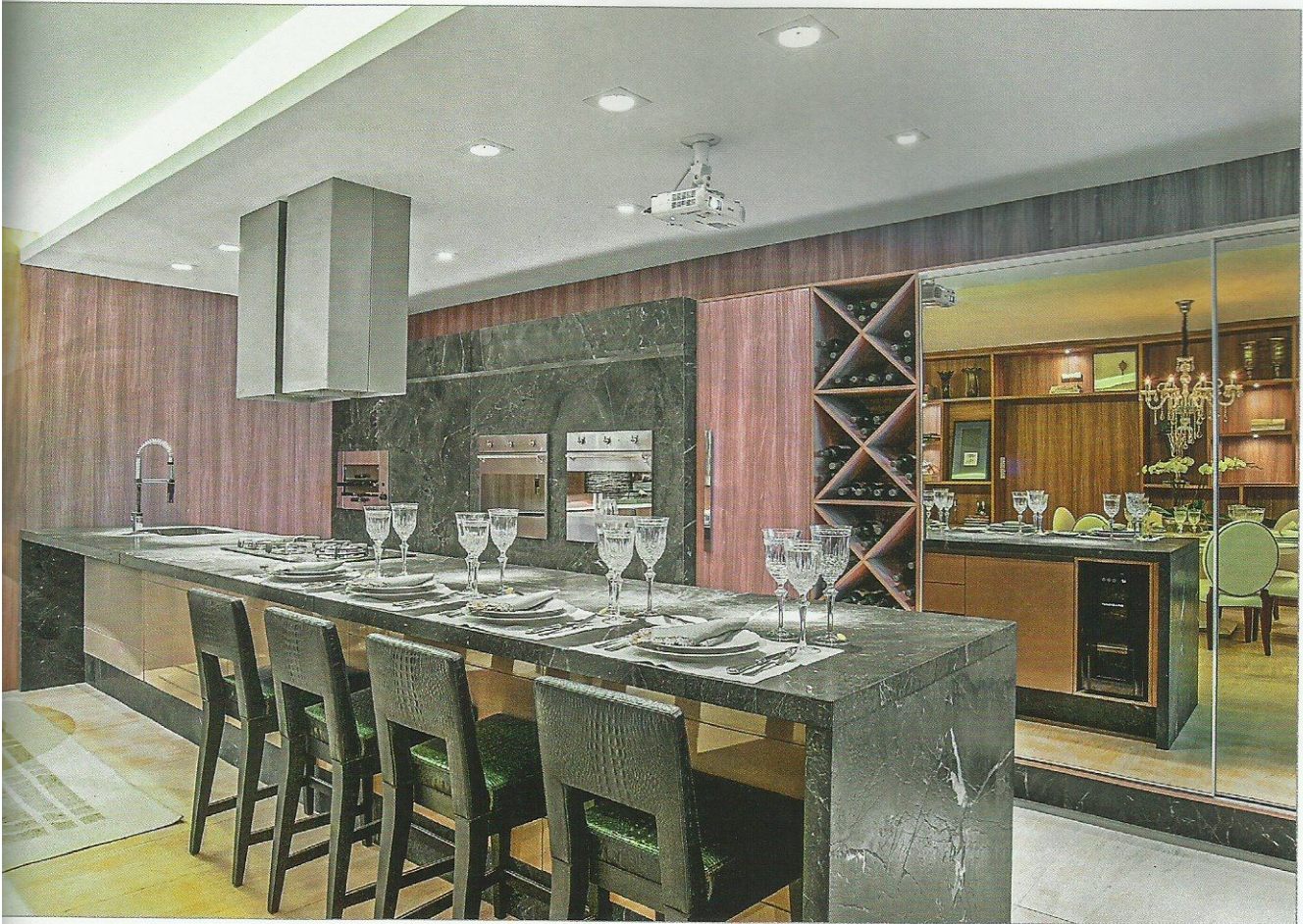
Bancada em granito exótico Preto Negresco e piso em Limestone (Gramarcal) Counter in exotic Preto Negresco granite and floor in Limestone (Gramarcal)

No piso foi especificado o Limestone. A bancada da ilha gourmet e o painel de fornos são revestidos com o granito exótico Preto Negresco. Destaque também para o tapete do Estar, que foi executado seguindo um desenho exclusivo, desenvolvido pelas profissionais, além dos acabamentos dos painéis.